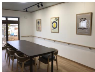
ダイニング(食堂側)